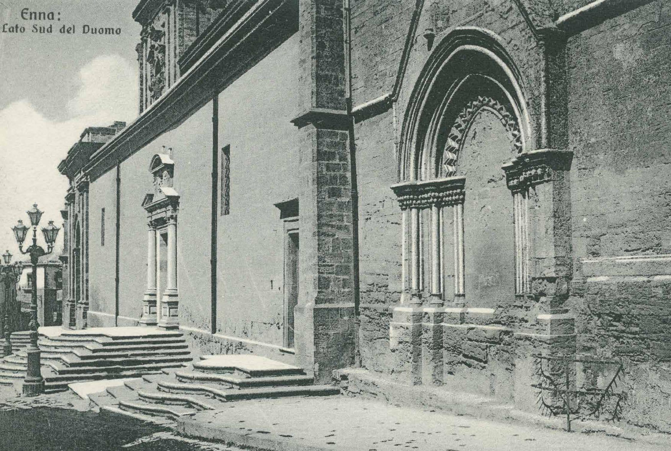
Enna: Lato Sud del Duomo