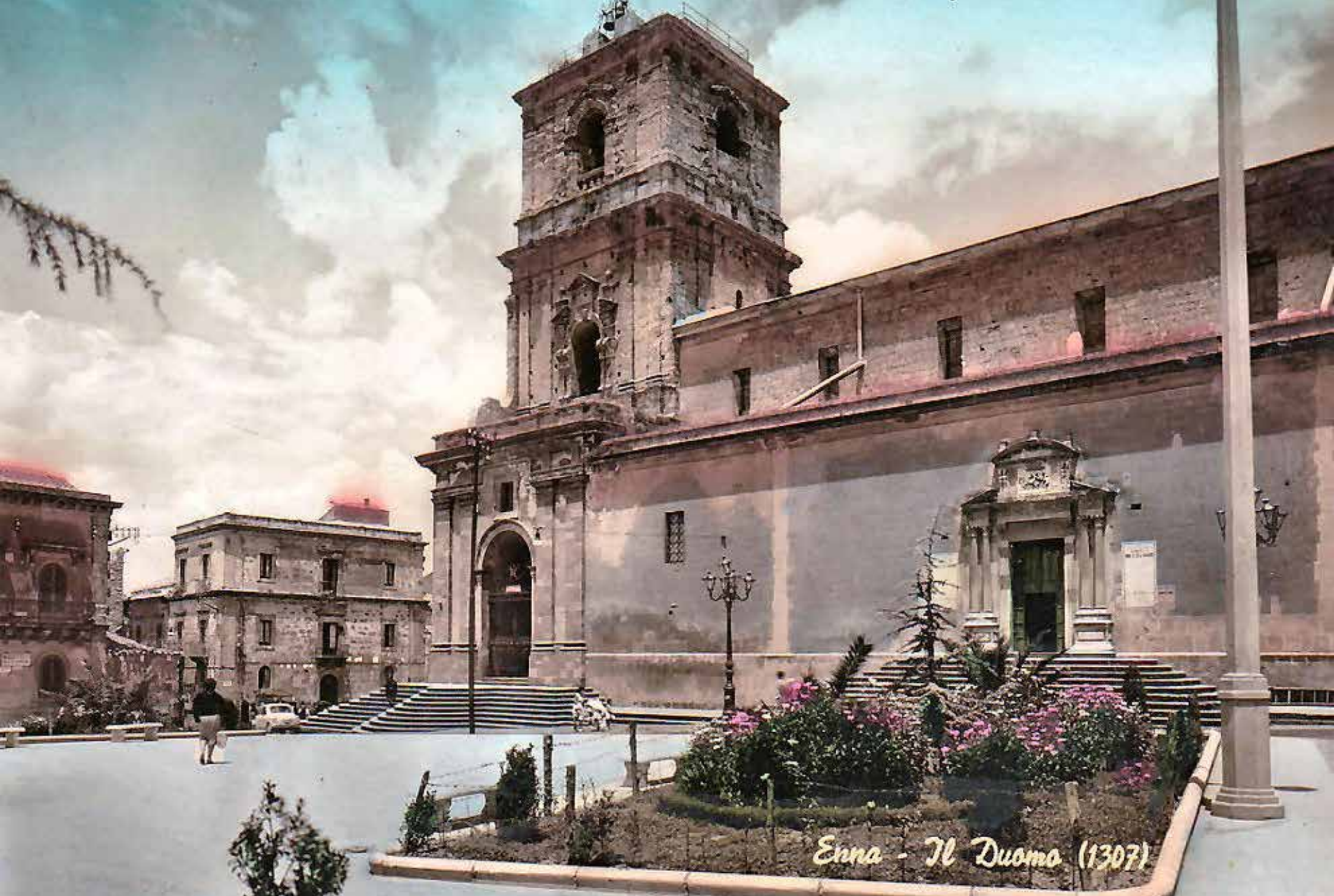
Enna - Il Duomo (1307)