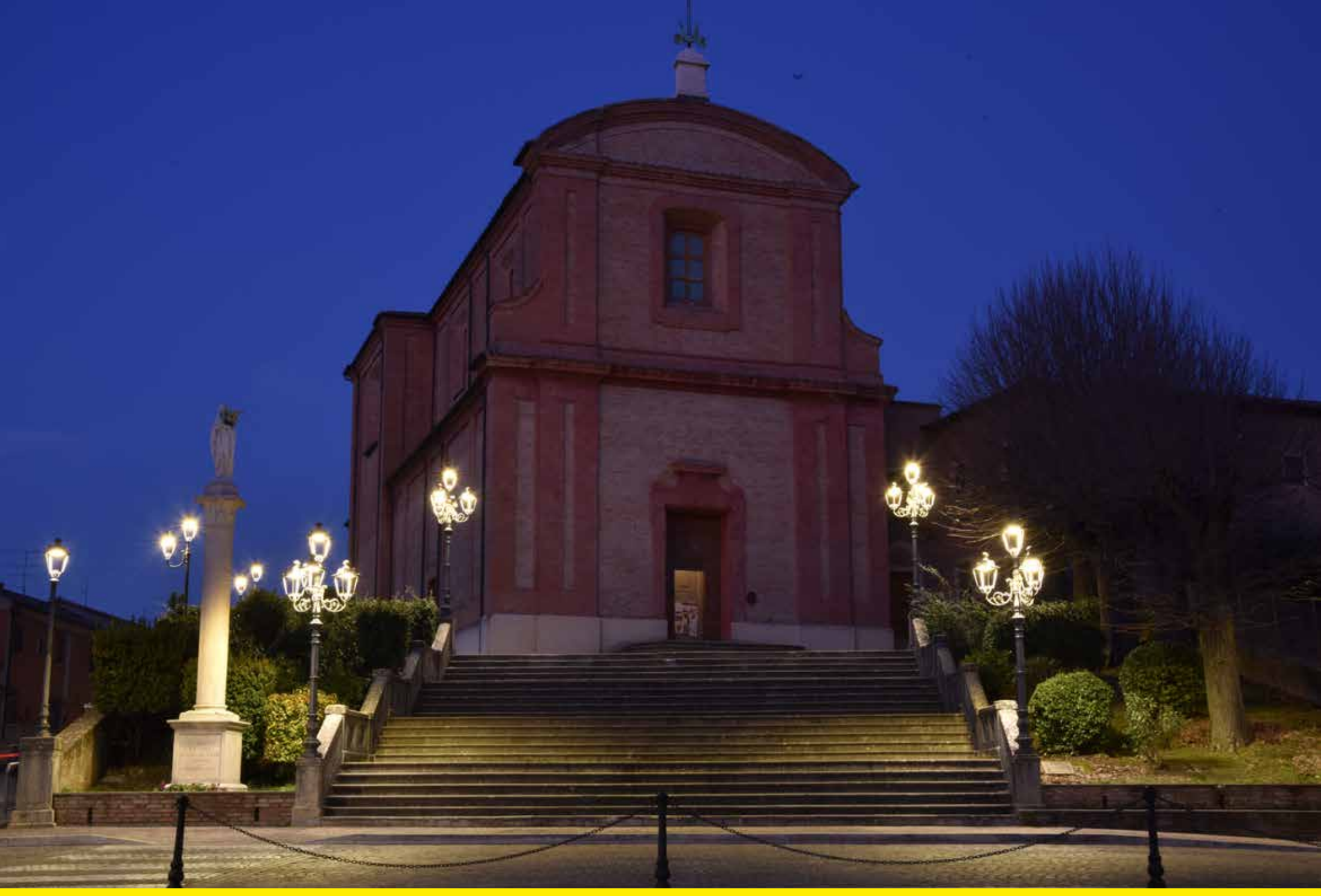
Longiano (Italy) | Refitting and lighting