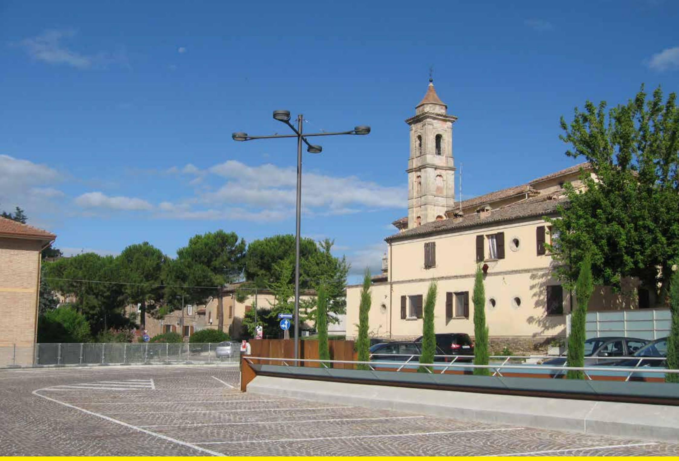
Longiano (Italy) | Refitting and lighting