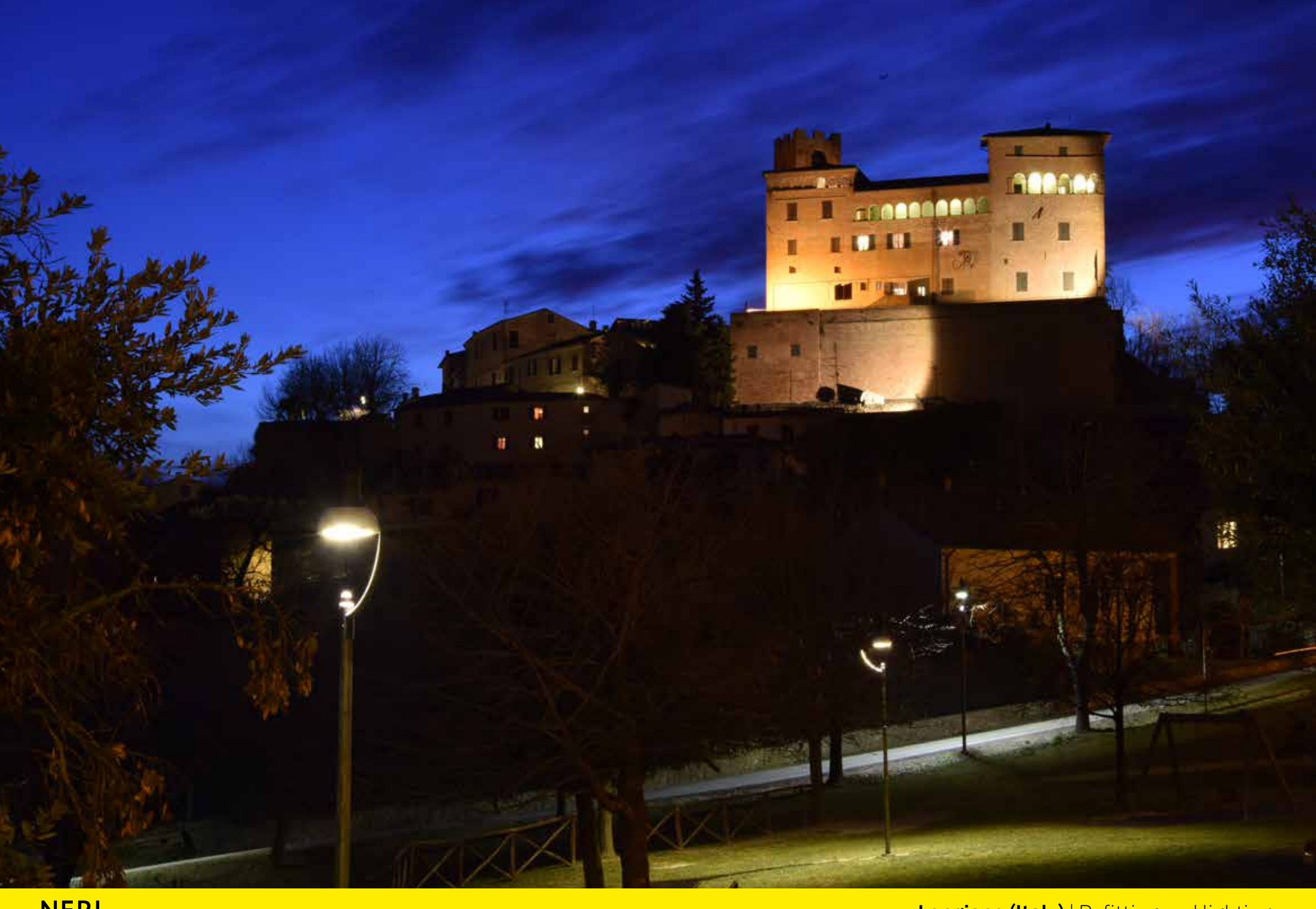
Longiano (Italy) | Refitting and lighting