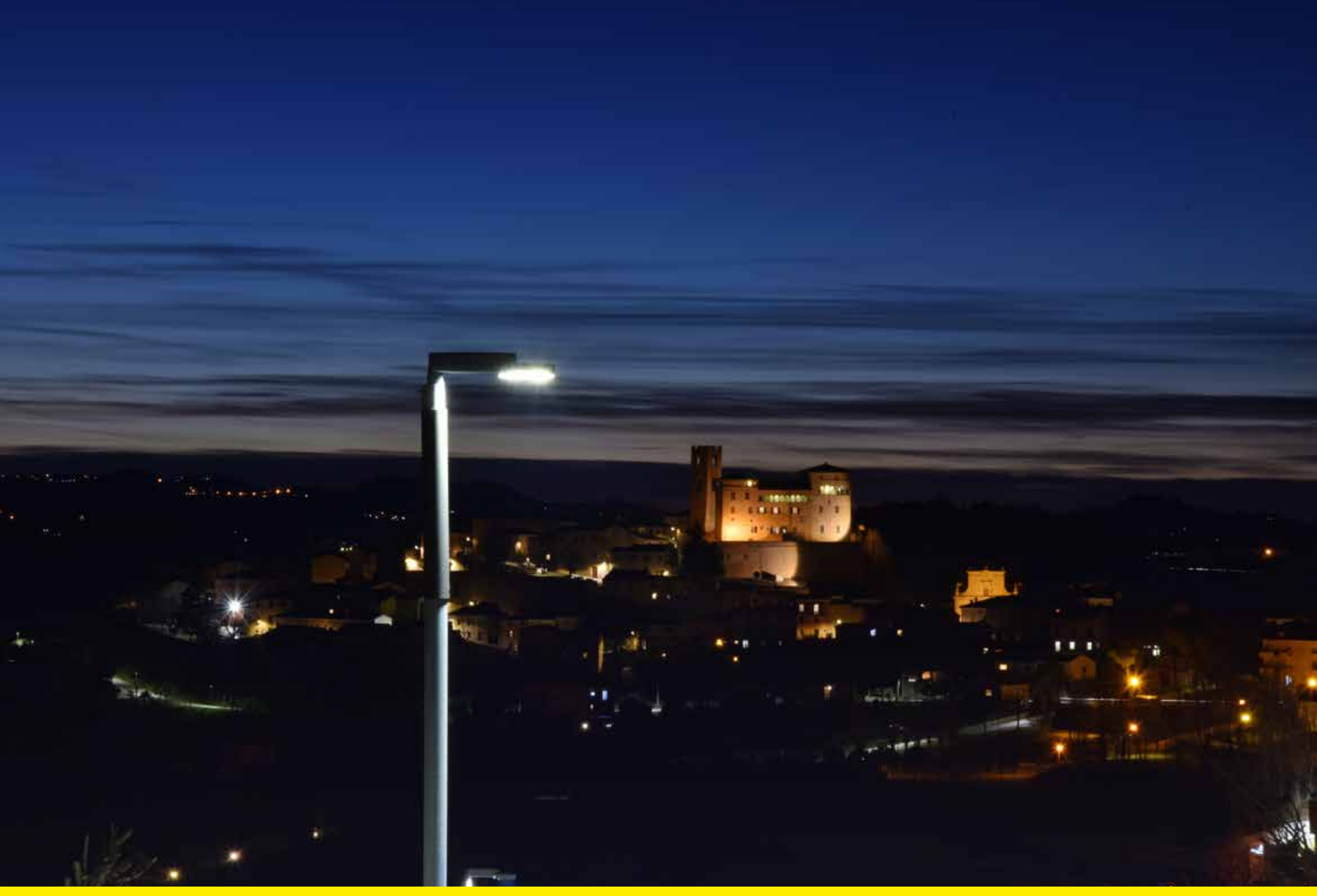
Longiano (Italy) | Refitting and lighting