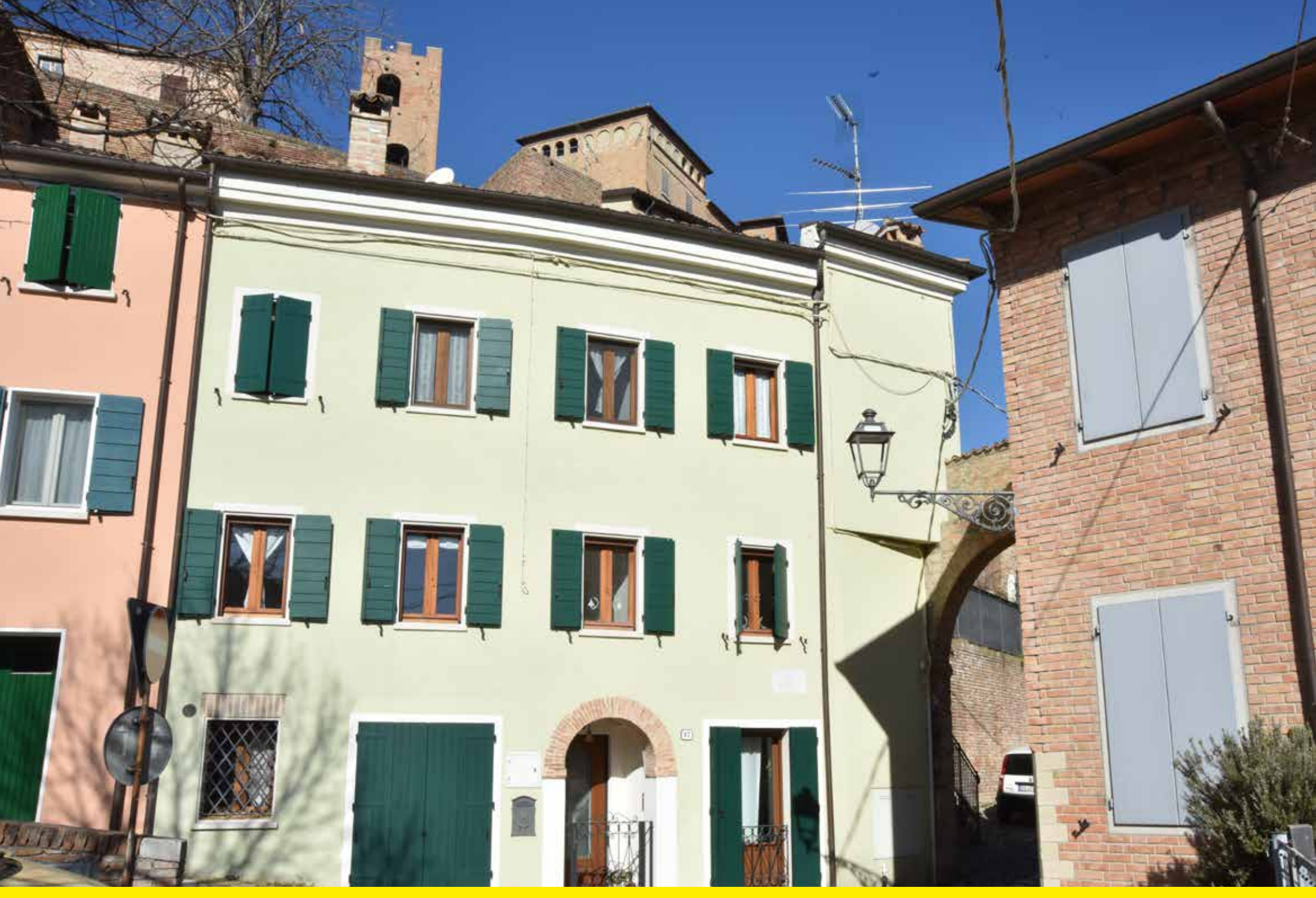
Longiano (Italy) | Refitting and lighting