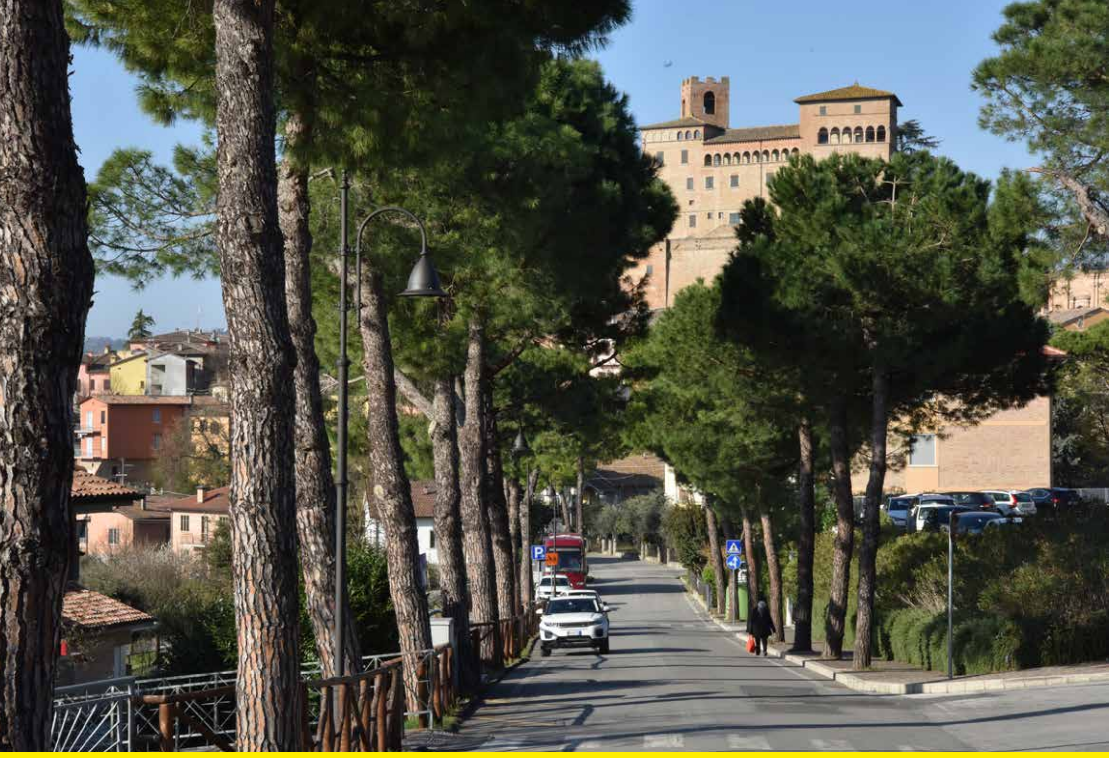
Longiano (Italy) | Refitting and lighting