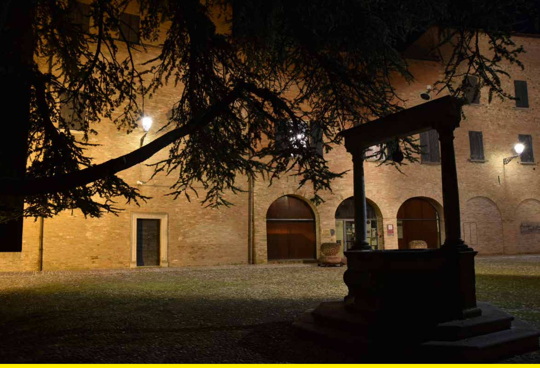
Longiano (Italy) | Refitting and lighting