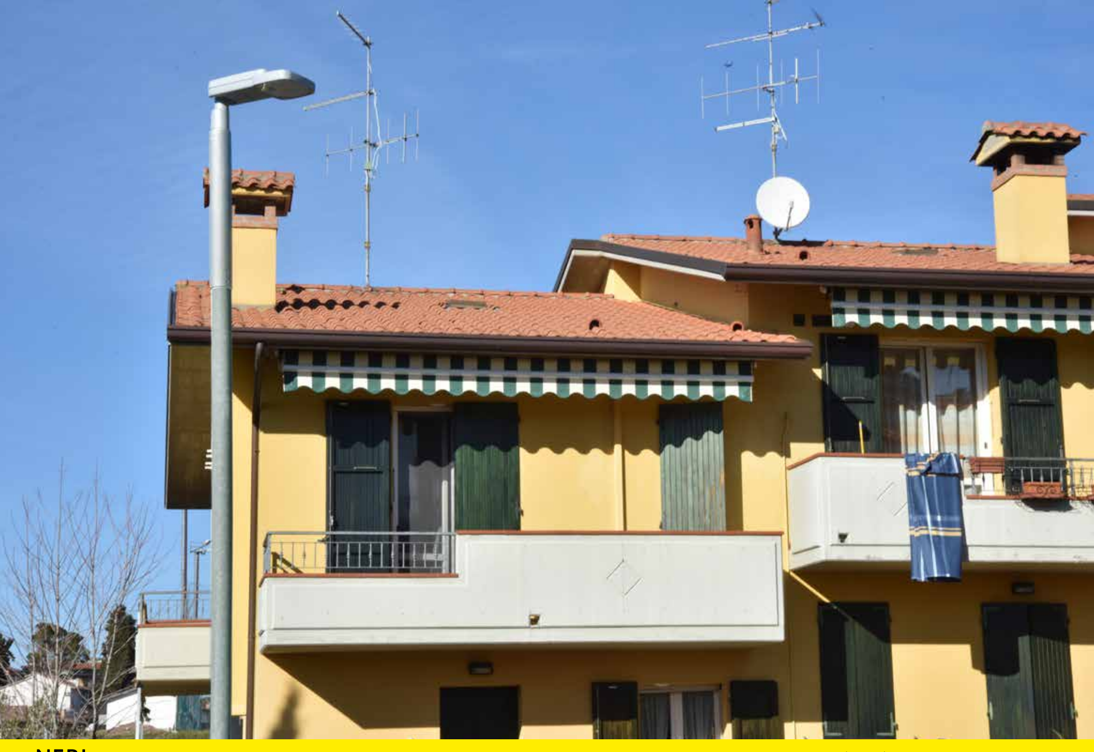
Longiano (Italy) | Refitting and lighting