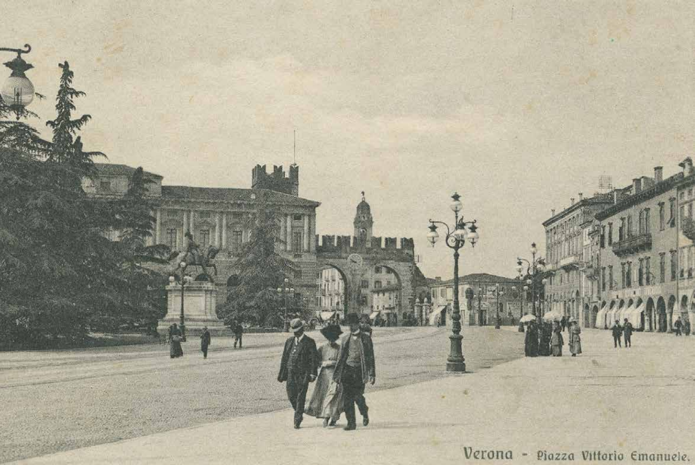
Verona - Piazza Vittorio Emanuele.