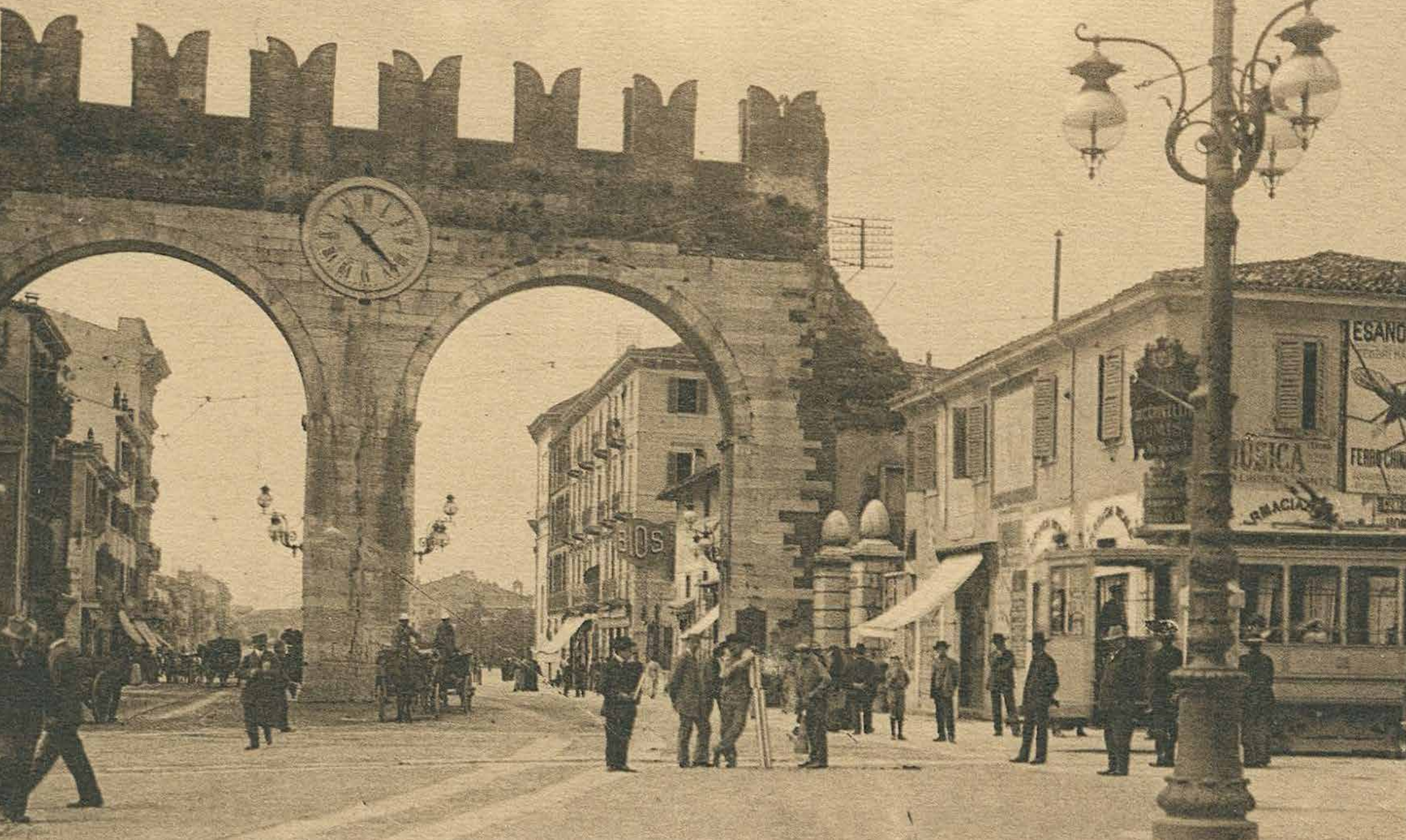
Verona - Portoni di Piazza Vittorio Emanuele (Brà)