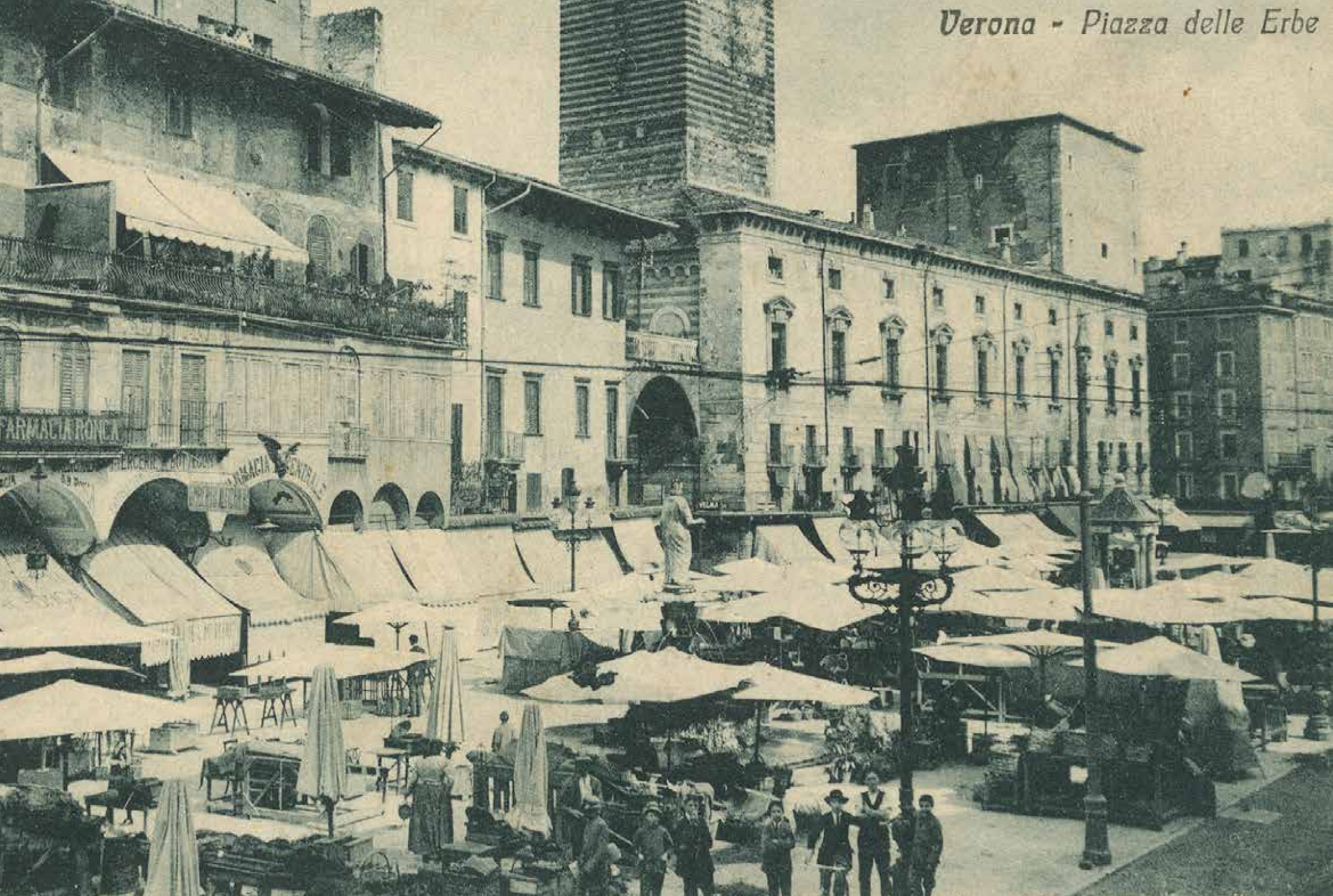
Verona - Piazza delle Erbe