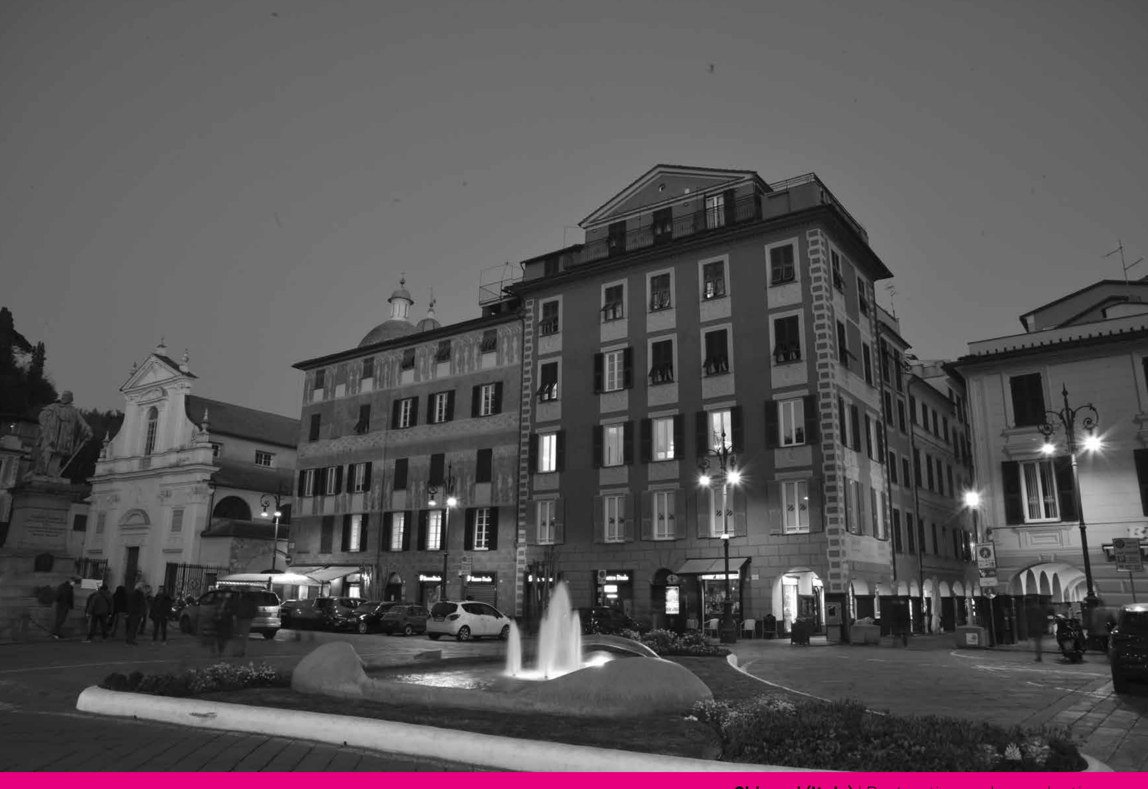
Chiavari (Italy) | Restoration and reproductions