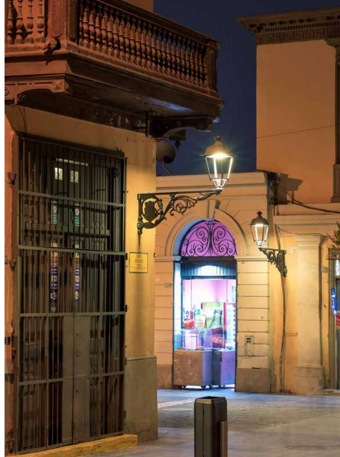
Lima (Perù) | Custom